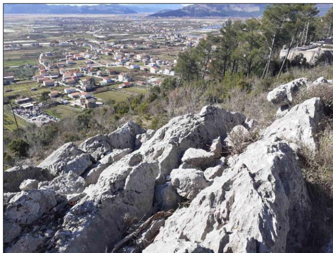
Slika 6. Vizure na okolni krajolik i dolinu Neretve.

U starijem dijelu groblja oko grobne kapele se nalazi više grobova koji su nastali nakon izgradnje grobne kapele te možda mogu imati arhitektonsko stilske ,kulturno-povijesne i estetsko umjetničke vrijednosti.Stoga bi bilo poželjno da se u posebnom postupku izradi popis kategorizacije najvrijednijih grobnih spomenika i utvrdi njihova eventualna spomenička vrijednost od nadležnog konzervatorskog odjela.