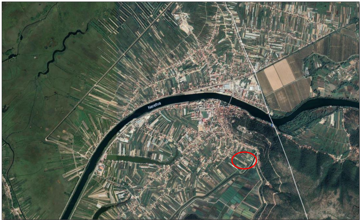
Slika 1.Položaj obuhvata groblja Sv.Ivana Nepomuka na ortofoto snimci gradskog područja Grada Metkovića.

Groblju Sv.Ivana Nepomuka gravitira gradsko područje grada Metkovića s ukupno oko 15.350 stanovnika.