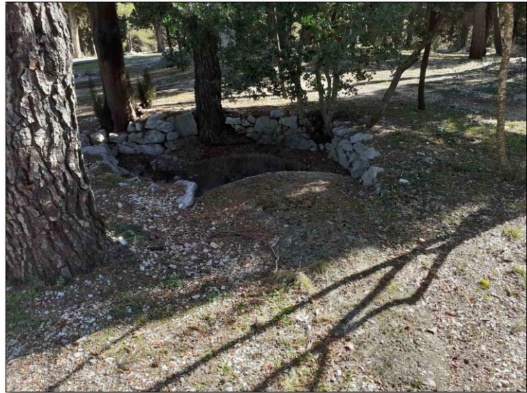
Slika 3 i 4.Zgrada mrtvačnice i oproštajno ceremonijalni prostor te ostaci napuštenih bunkera iz II.svjetskog rata.