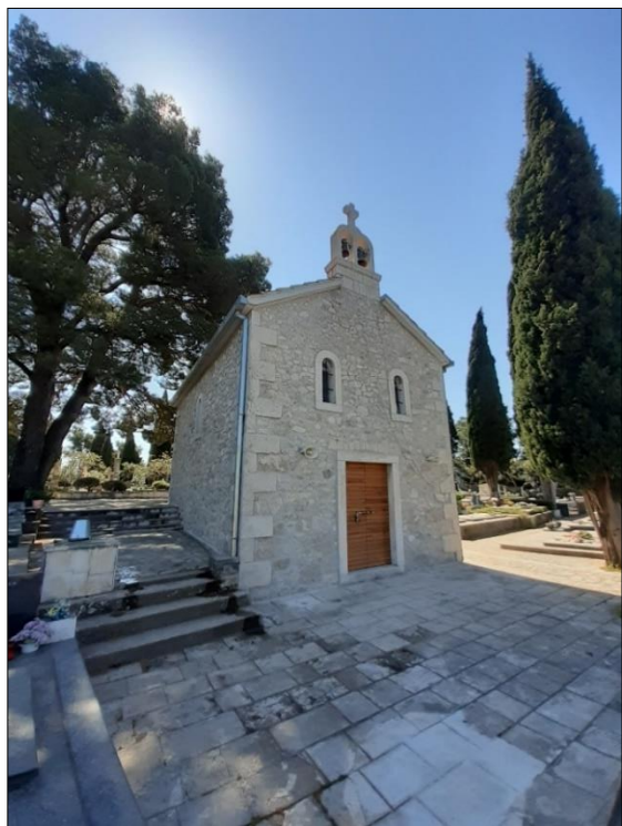
Slika 5. Crkva i grobna kapela sv.Ivana Nepomuka i sv .Roka.