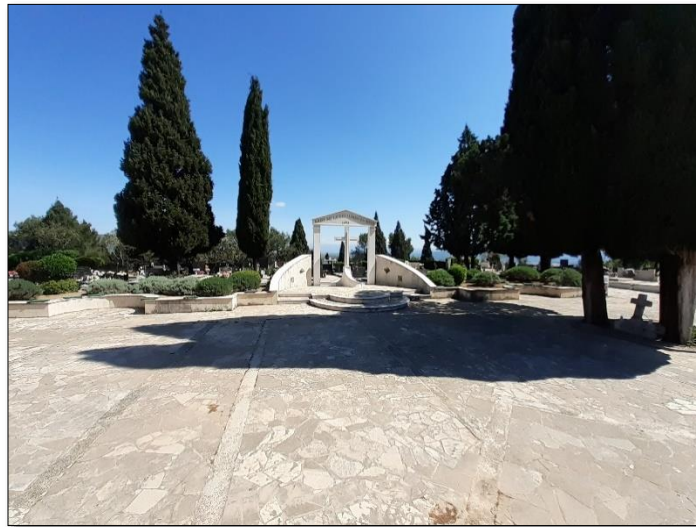
Slika 2.Središnji spomen križ i plato unutar groblja.

S obzirom na strmu konfiguraciju terena, groblje je uglavnom omeđeno potpornim zidovima do maksimalne visine h=5,50\text{m} .